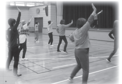
ソフトエアロビクス